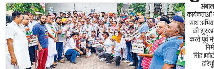
अंबाला। कार्यकर्ताओं के साथ अभियान की शुरुआत करते पूर्व मंत्री निर्मल सिंह

अंबाला। मंत्री निर्मल सिंह ने 'हरियाणा मांगे हिसाब' अभियान की शुरुआत वीरवार को अंबाला शहर की हाउसिंग बोर्ड कॉलोनी, सेक्टर आठ, शारदा नगर, परशुराम नगर, रतनगढ़ कॉलोनी से की। इस दौरान उन्होंने भाजपा सरकार के 10 साल के कुशासन के खिलाफ जवाब मांगा। शहर के लोगों ने सड़क, सीवर, सफाई से जुड़ी अनेको समस्याएं भी बताईं। इसके अलावा लोगों का कहना था कि वे पोर्टल और तमाम तरह की आईडी से परेशान हो चुके हैं और सरकारी विभागों के चक्कर काटकर थक चुके हैं। इस पर निर्मल सिंह ने उन्हें आश्चर्य किया कि कांग्रेस सरकार आने पर इन जनविरोधी