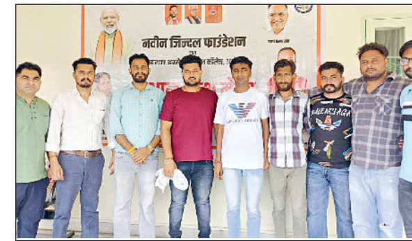
कुरुक्षेत्र। जितल हाऊस में मौजूद युवा।