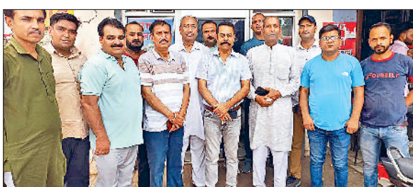
यमुनानगर। कन्हैया चौक के नजदीक आयोजित बैठक में भाग लेने जाते क्षत्रिय समाज के लोग।

क्षत्रिय एकता महासभा यमुनानगर की वीरवार को शहर के कन्हैया साहिब चौक के नजदीक आक्समिक बैठक का आयोजन किया गया। बैठक में गत दिवस रादौर में आयोजित भाजपा की बैठक में से क्षत्रिय समाज के पूर्व विधायक रहे श्याम राणा को पूर्व राज्यमंत्री कर्णदेव कांबोज द्वारा जबरन बाहर निकल जाने पर मजबूर करके अपमान करने की कड़ी निंदा की गई। बैठक में क्षत्रिय एकता महासभा ने प्रधानमंत्री नरेंद्र मोदी और गृहमंत्री को ज्ञापन भेजकर पूर्व राज्यमंत्री कर्णदेव कांबोज के