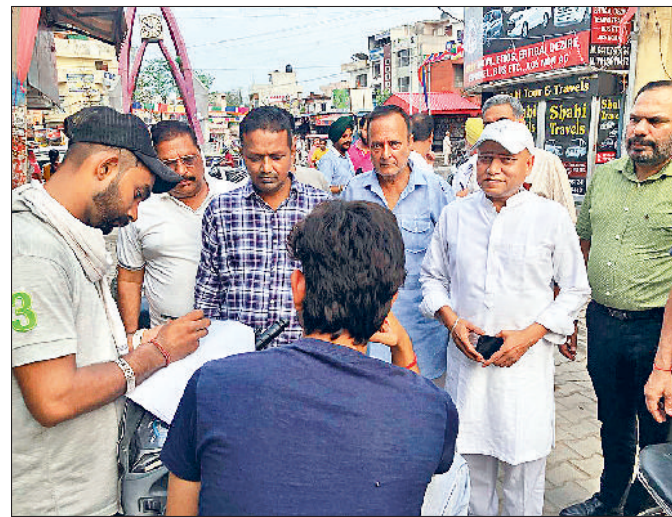
अंबाला। हस्ताक्षर अभियान में शामिल होते लोग।