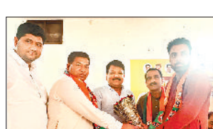
अंबाला। जिला कोषाध्यक्ष का अभिनंदन करते भाजपा पदाधिकारी।